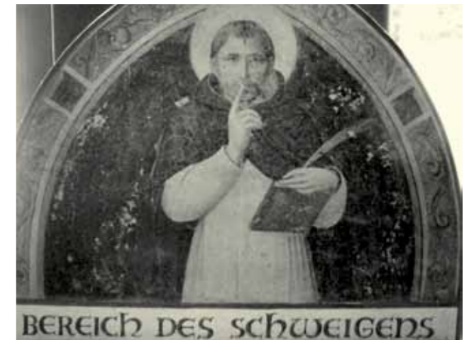
BEREICH DES SCHWEIGENS