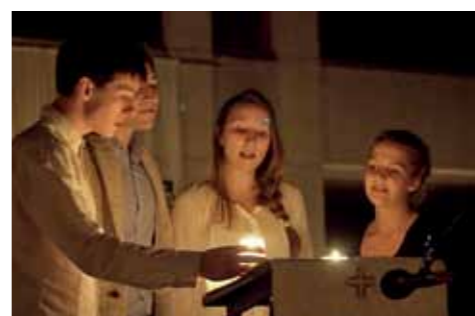
Karsamstag: Wir spüren die Verheißung der Auferstehung.