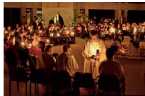
Emmausgang: Rast auf der Römerwand und bei der Mariengrotte.