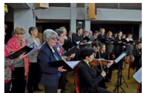
Ostersonntag: Festliches Hochamt mit der Orgelsolomesse von Haydn.