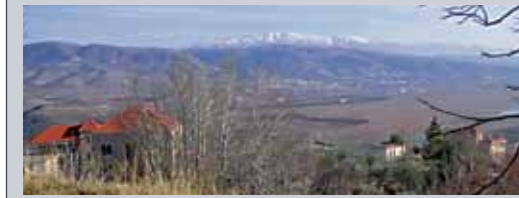
Die Bekaa-Ebene mit dem Blick auf den Berg Hermon.