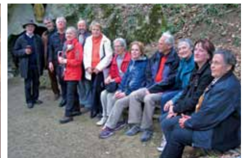
Emmausgang: Rast auf der Römerwand und bei der Mariengrotte.