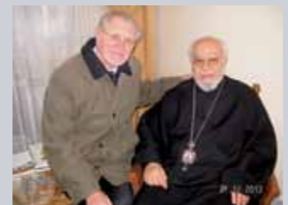
P. Jakob und der Erzbischof von Beirut.

konnten viele aus erster Hand erfahren, wie er die Lage im Nachbarland des Libanon einschätzt.