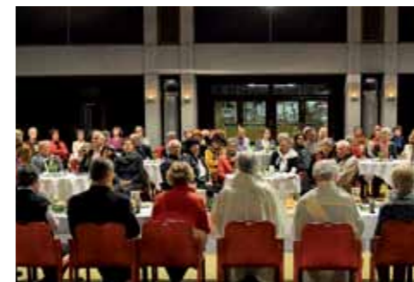
Gründonnerstag: Abendmahl mit Brot und Wein.