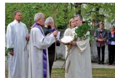
Palmsonntag: Palmkätzchenweihe auf dem Labyrinth.